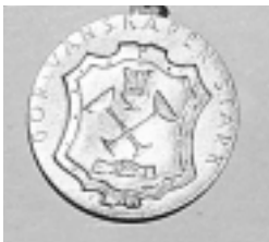
GÖSTA W SÖDERBERGS MEDALJ