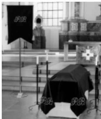
Banéret och Bårtäcket

P.B.-kontakten inom Par Bricole har tillsammans med A.F. Beckmans Begravningsbyrå tagit fram ett Bårtäcke och ett Katafalktäcke som kan användas vid Ordensbroders begravning. Färgen är purpurröd med bokstäverna "PB" i guld mycket diskret i hörnen. Ett Bané i samma vackra färg med bokstäverna "PB" i guld, samt ställ finns även, så att detta kan stå framme i koret vid baren. Kontakta Kansliet för mer information.