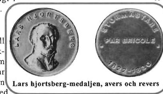
Lars hjortsberg-medaljen, avers och revers