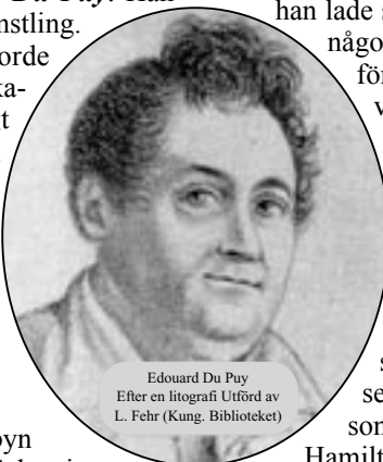
Edouard Du Puy Efter en litografi utförd av L. Fehr (Kung. Biblioteket)