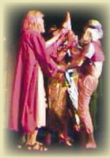
Salome, Salomo och Hatshepsut i balansakt.