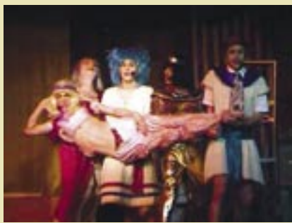
Mutnefrit (Lars Cedergårdh) trängd av Tutmosis II (Tim Bowden) och Hatshepsut (Pino Pilotti). >

Magen till artist får man leta efter! Salome (Åke Bjurström) brer ut sig i famnen hos Mutnefrit, Tutmosis II, Senmut (Fredrik Wallin) och Hatshepsut. <