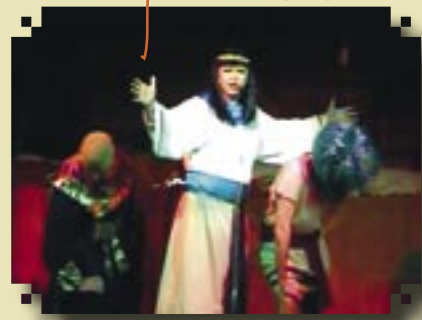
Mutnefrit sjunger ut!