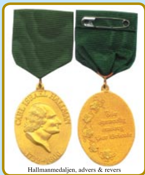
Hallmanmedaljen, avers & revers