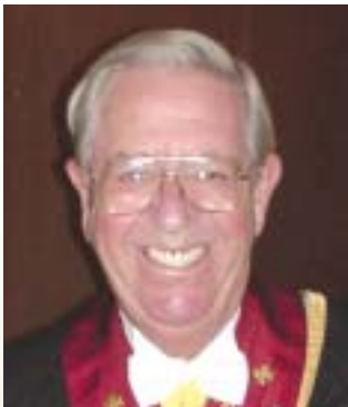
Stormästaren har ordet (sid 2)