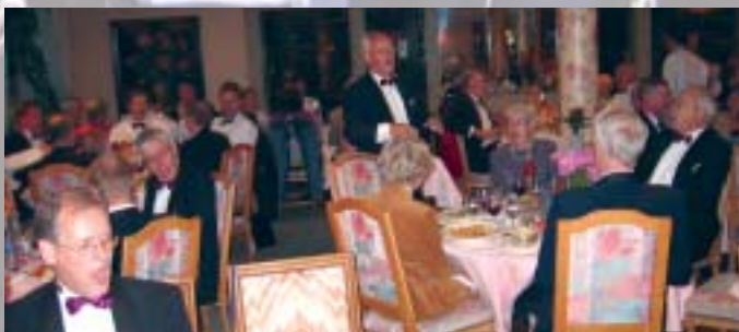
Under den gemensamma middagen i Vianden sjöngs vinets lov åtskilliga gånger.