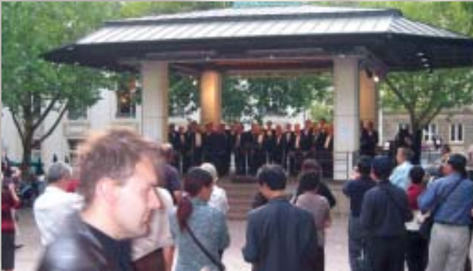
Många åhörare samlades vid körens profana utomhuskonsert i Luxemburg City.

Vid 15.00-tiden påbörjades repetitionerna inför dagens profana utomhuskonsert på Place d'Armes. Klockan 17.00 stod så alla körmedlemmarna iförda smoking med kardinalröd fluga och gördel på den stora utomhusscenen och när