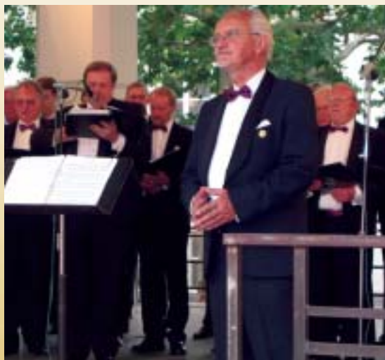
Bacchanaliskt Ljus i Luxemburg! (sid 8-9)