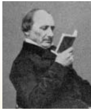
Talis Qualis (sid 6)