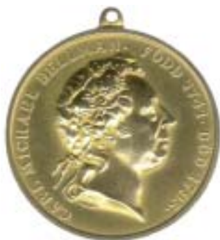
Fig 1 ovan, fig 2 nedan

utmärkelse fick sitt gyllengula band). Vidare var det i denna veva medaljen kom att få ställning som "belöning för yppersta talang och lyskraft" vilket den än idag representerar. Medaljens avers (fig 1) visar Bellmans profil, efter Sergells medaljong.