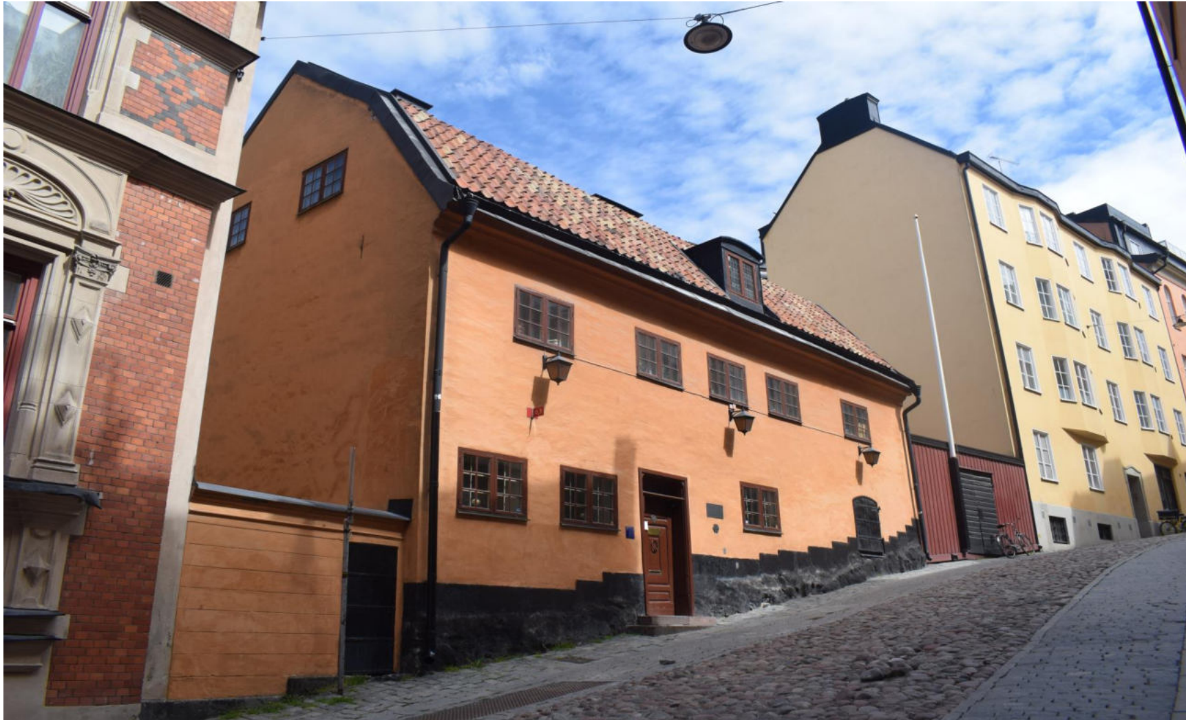
Bellmanmiljöer – Del 1