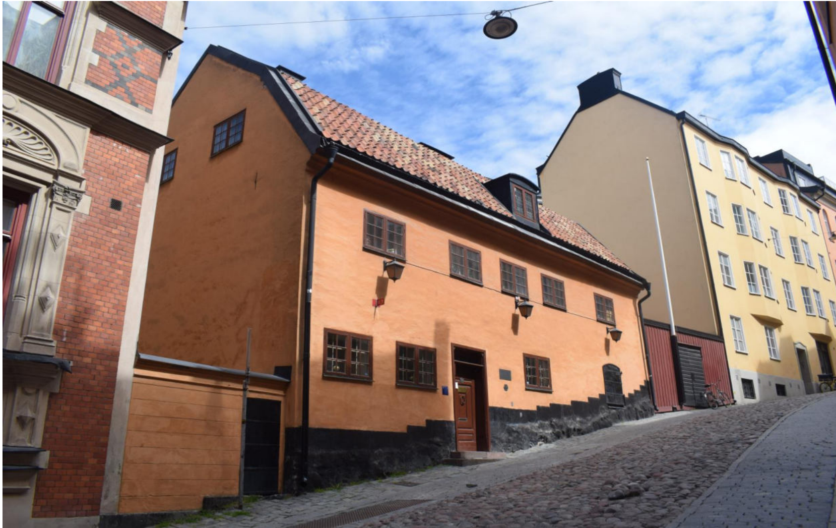
Bellmanmiljöer – Del 5